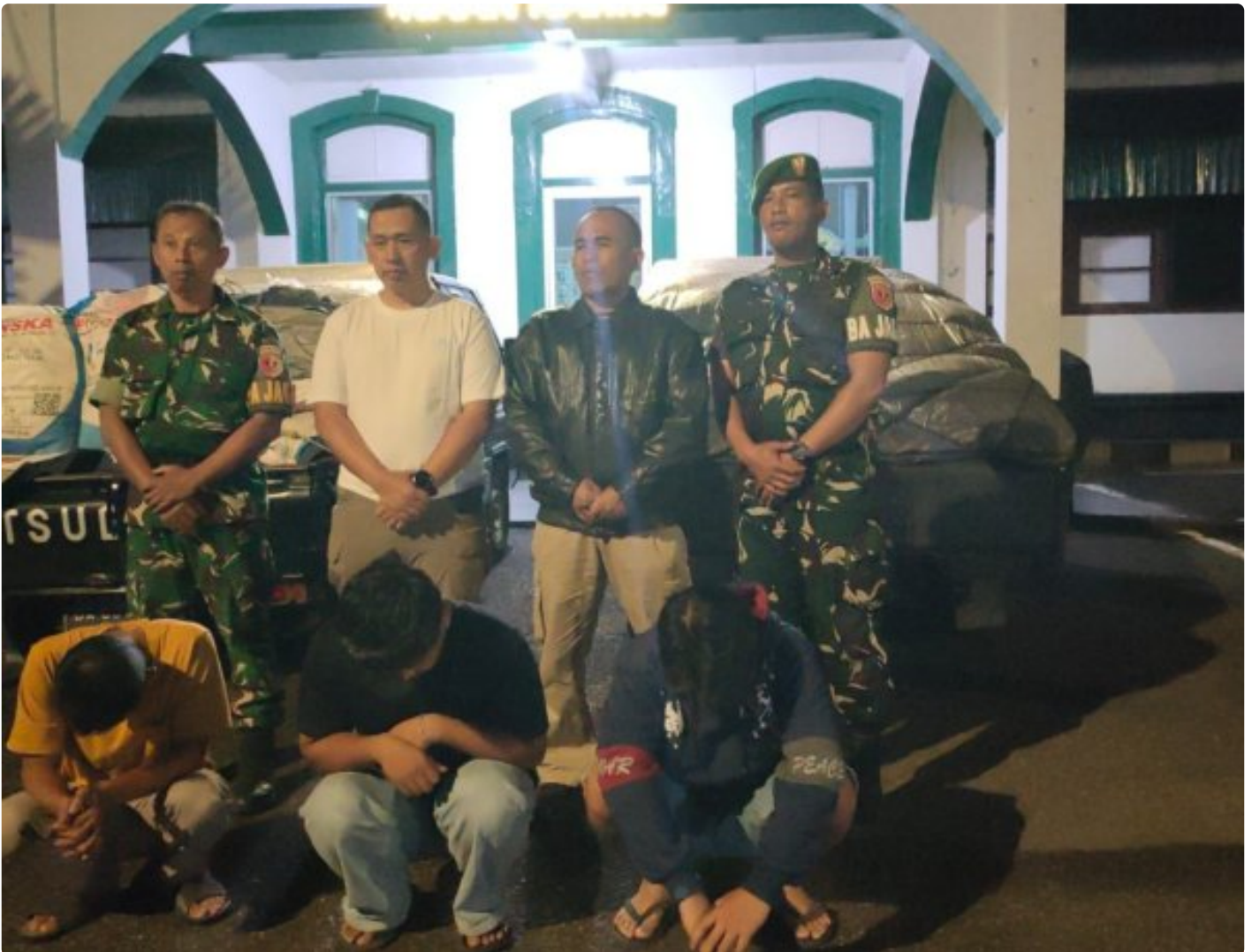
Kodim 0304/Agam Amankan Tiga Pelaku Penjualan Pupuk Bersubsidi di Gadut, Satu Orang Kabur

Bukittinggi — Aparat Kodim 0304/Agam berhasil mengamankan tiga orang terduga pelaku penyalahgunaan pupuk bersubsidi di wilayah Gadut, Agam